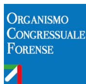
Illustrazione del D.L. n. 11 dell'8 marzo 2020 (a cura dell'Ufficio di monitoraggio dell'OCF)

È stato pubblicato sulla Gazzetta Ufficiale nr. 60 dell'08.03.2020 il decreto-legge con le “Misure straordinarie ed urgenti per contrastare l'emergenza epidemiologica da COVID-19 e contenere gli effetti nello svolgimento dell'attività giudiziaria” .